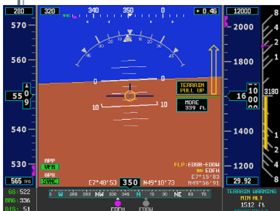
GNSS-TECH Principal Affichage pour Avions

Les séries GNSS-TECH Q12 emploient également l'avantageux HORIZON 60 comme une option AHRS pour les avions expérimentaux et les drones.