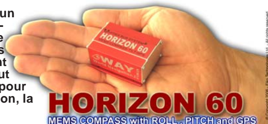
HORIZON 60 MEMS COMPASS with ROLL, PITCH and GPS